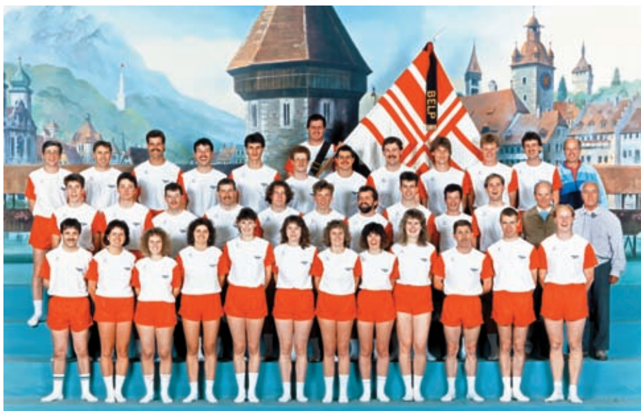
Eidg. Turnfest 1991 in Luzern.

An dieser Stelle soll auf eine weitere erfolgreiche Seite der Belper Turner in diesen Jahren hingewiesen werden: das Skifahren. Anfang 1987 siegte der die Mannschaft des TV Belp sowohl am MTV-Skitag, wie auch am Wettkampf der besten skifahrenden Turnern der Schweiz in der Kombination Abfahrt/Langlauf. In diesen Jahren feierten die Skifahrer des TV Belp regelmässige Er-